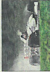
Billy Ritchen, à Turckheim.

Dans cette course, la météo joue un rôle déterminant. Afin que l'épreuve se déroule sans souci, les organisateurs rappellent au public qu'il faudra rester dans les zones de sécurité qui seront matérialisées.