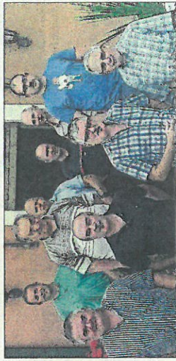
Les organisateurs de la course de côte de Sewen.